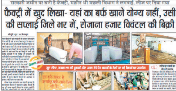
हरिभूमि में प्रकाशित खबर।

जिले सहित शहर में 30 से अधिक आइस फैक्ट्री हैं लेकिन किसी के पास लाइसेंस तक नहीं है। यहां बड़े स्तर पर बर्फ की सिल्ली बनाई