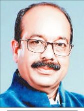
डिप्टी सीएम साव की अनुशंसा पर कार्यों को मिली मंजूरी

लोरमी। क्षेत्रीय विधायक एवं उपमुख्यमंत्री अरुण साव के 5.60, शापा स्कूल औरबांधा के अनुशंसा पर संचालक, लोक शिक्षण संचालनालय की ओर से विभिन्न शासकीय शालाओं में लघु निर्माण कार्यों की स्वीकृति प्रदान की गई। इसके तहत प्रदेश की 10 स्कूलों में अहाता एवं 5 स्कूल में मरम्मत कार्य के लिए 82 लाख 38 हजार रुपये स्वीकृत किए गए। स्वीकृत कार्यों के अनुसार अहाता निर्माण हेतु शास पूमा स्कूल डोंगरीगढ़ के लिए 8 लाख, शापा स्कूल जोतपुर के लिए 5.60 लाख, शापा स्कूल आंछीडोंगरी के लिए 5.60 लाख, शापा स्कूल सुकली के लिए 5.60, शापा शाला चंदिवाभाटा के लिए 5.60, शापा शाला के लिए चचेडी, 5.60, प्राथमिक शाला बोईहा के लिए 5.60, प्राथमिक शाला खुडिया के लिए 5.60 रुपये स्वीकृत हुए हैं। इसी तरह मरम्मत कार्य के लिए शापा शाला जोतपुर में 3.70, शापा शाला आंछीडोंगरी में 3.70, शापा शाला कुटेलाटोला में 3.70, मिडिल स्कूल भवन गोडुखाम्ही में 6.44 लाख स्वीकृत हुए हैं। इस तरह कुल 82 लाख 38 हजार की स्वीकृति प्रदान की गई है।