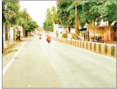
गर्मी के चलते शहर की सड़क पर छाया सन्नाटा।