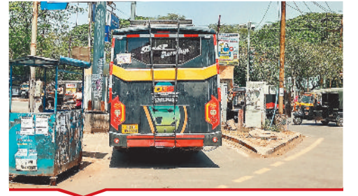
इंदु चौक स्थित लेफ्ट टर्न में बस खड़ी कर दी जाती है। जिसके चलते ट्रैफिक जाम होता है।

[बिल्हा | मस्तूरी | तखतपुर | मुंगेली | कोटा | लोरमी | सरगांव | पेंड़ा | बेलतरा | रतनपुर | पथरिया]