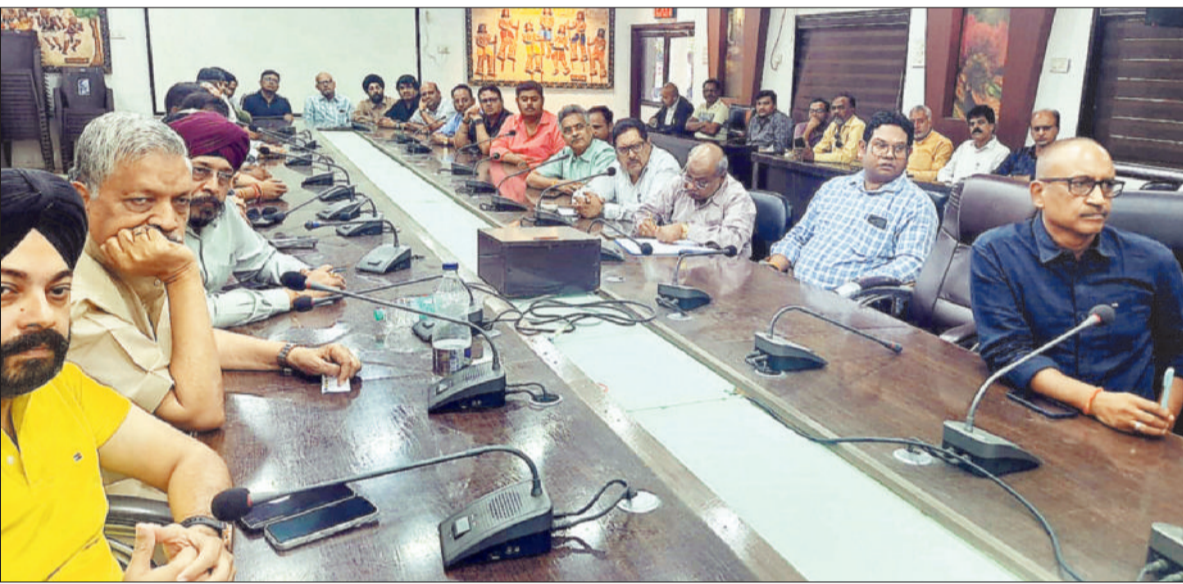
कलेक्टोरेट मंथन सभाकक्ष में पेट्रोल-डीजल संचालकों की बैठक लेते कलेक्टर।

कलेक्टर ने यह भी निर्देश दिए हैं कि जिले में पेट्रोलियम पदार्थों की परिवहन पर विशेष निगरानी रखी जाएगी। पेट्रोल पंप परिसरों में लगे सीसीटीवी कैमरों की नियमित जांच की जाएगी। अवैध परिवहन या कालाबाजारी की स्थिति में आवश्यक वस्तु अधिनियम, 1955 के तहत सख्त कार्रवाई सुनिश्चित की जाएगी। आदेश के प्रभावी क्रियान्वयन के लिए जांच दल का गठन किया गया है, जो जिलेभर में सतत निगरानी एवं निरीक्षण करेगा। संबंधित अधिकारियों को अपने-अपने क्षेत्रों में नियमित पर्यवेक्षण के निर्देश दिए गए हैं। कलेक्टर ने स्पष्ट किया है कि यह आदेश तत्काल प्रभाव से लागू कर दिया गया है तथा सभी संबंधितों को