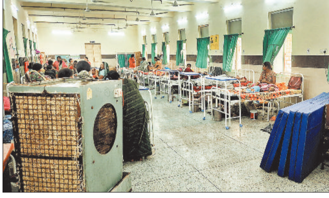
सिम्स में मरीजों की सुविधा के लिए लगाए गए कूलर में पानी की व्यवस्था नहीं।

लाखों रूपए खर्च कर भी सरकारी अस्पतालों में मरीजों को गर्मी से राहत पाने के लिए बड़ी मशक्कत करनी पड़ रही है। माच खत्म होने वाला है और गर्मी